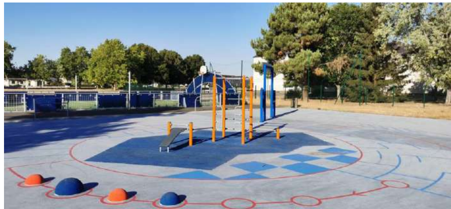
Aire de Fitness - Le Lude (72)