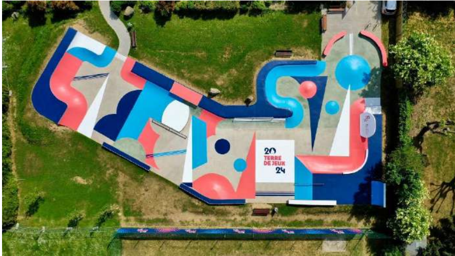
Skate-park - Pontoise (95)