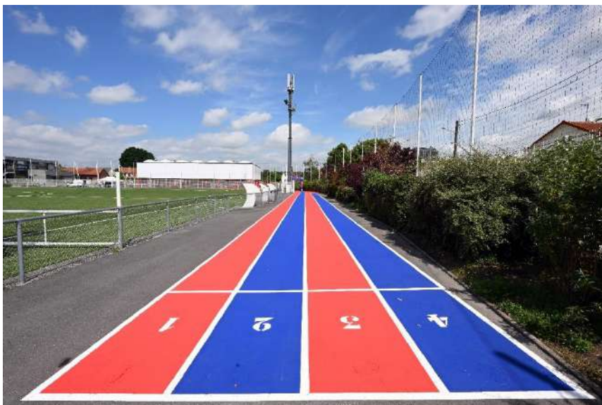
Piste d'athlétisme de proximité – Tremblay (93)